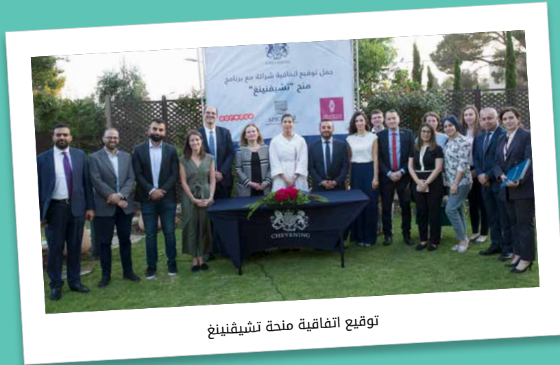
توقيع اتفاقية منحة تشيبنينغ

على مدار عام 2022 ساهمت Ooredoo فلسطين في العديد من الأنشطة والفعاليات التعليمية التي تستهدف الطلبة والمعلمين في المدارس والجامعات، وتفتخر الشركة بهذه المساهمات المتنوعة في قطاع التعليم، كونها تتماشى مع رؤية الشركة في الاستثمار بالإنسان لصناعة مستقبل واعد ومشرق، فقدمت Ooredoo فلسطين دعماً للاتحاد العام للمعلمين الفلسطينيين تعزيزاً للعلاقة الإستراتيجية التي امتدت منذ سنوات بين الشركة