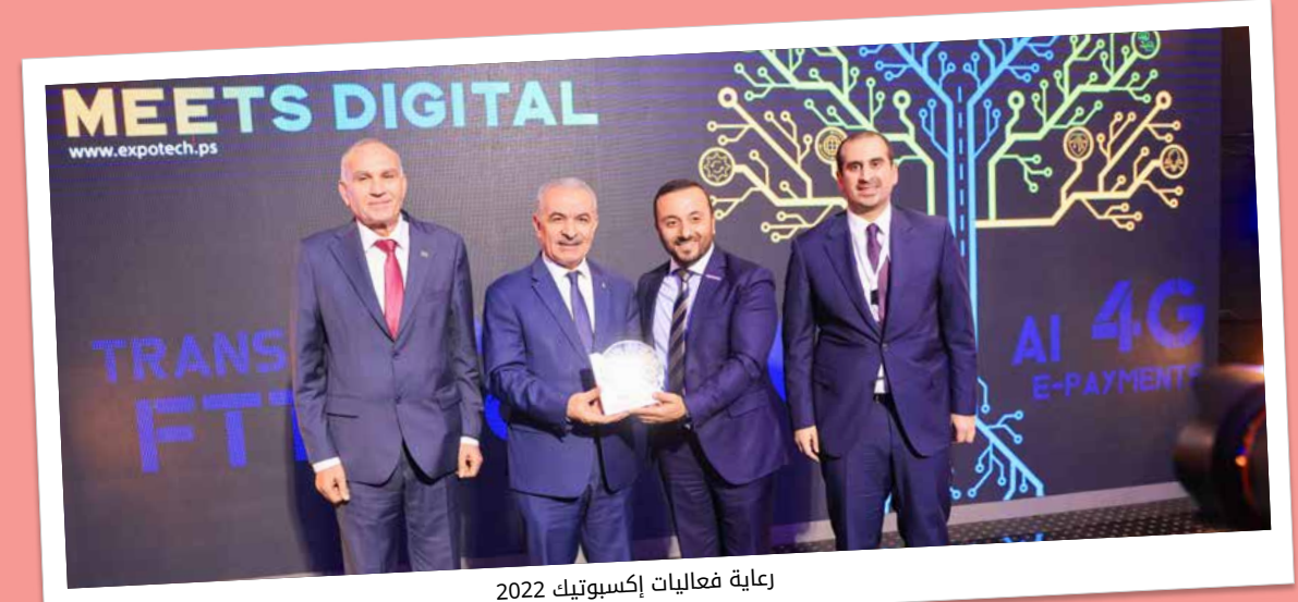
رعاية فعاليات إكسبوتك 2022