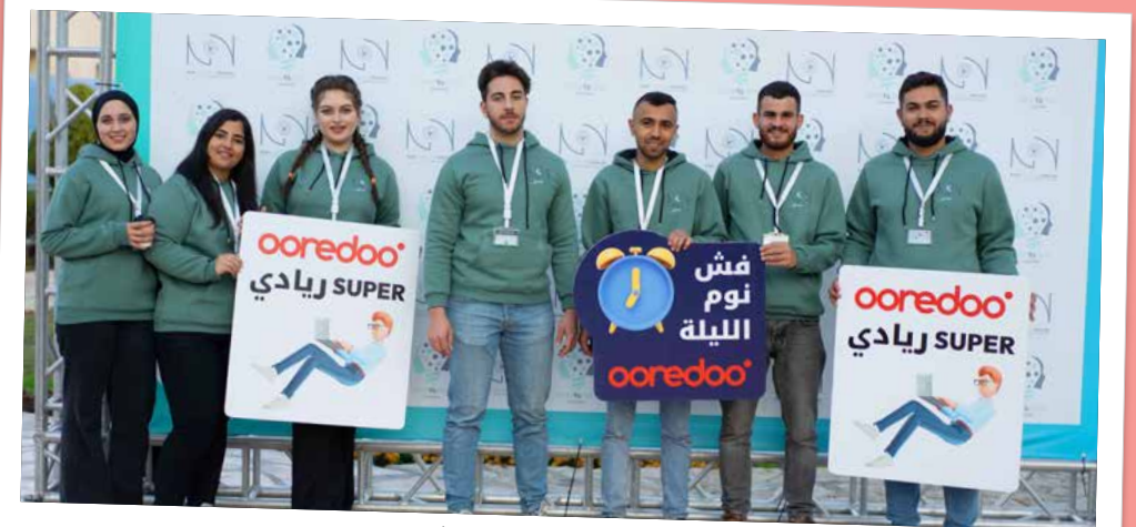
المساهمة بإقامة الهاكاثون

هي أحد المجالات المهمة التي تركز عليها Ooredoo فلسطين كونها القطاع الحاضن لأعمال الشركة، والمستقبل الواعد لمجتمعنا الفلسطيني، حيث إن هذه الرؤية لا تنطبق فقط على الأهداف التجارية للشركة، إنما تنعكس أيضًا على جملة من الرعايات والمساهمات المتنوعة التي تقدمها لمجتمعنا الفلسطيني، حيث قامت الشركة بتخصيص عدد من المساهمات والرعايات لتغطي احتياجات القطاع