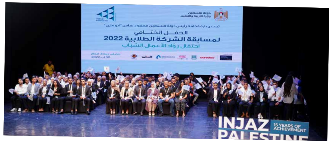
الحفل السنوي لمؤسسة إنجاز